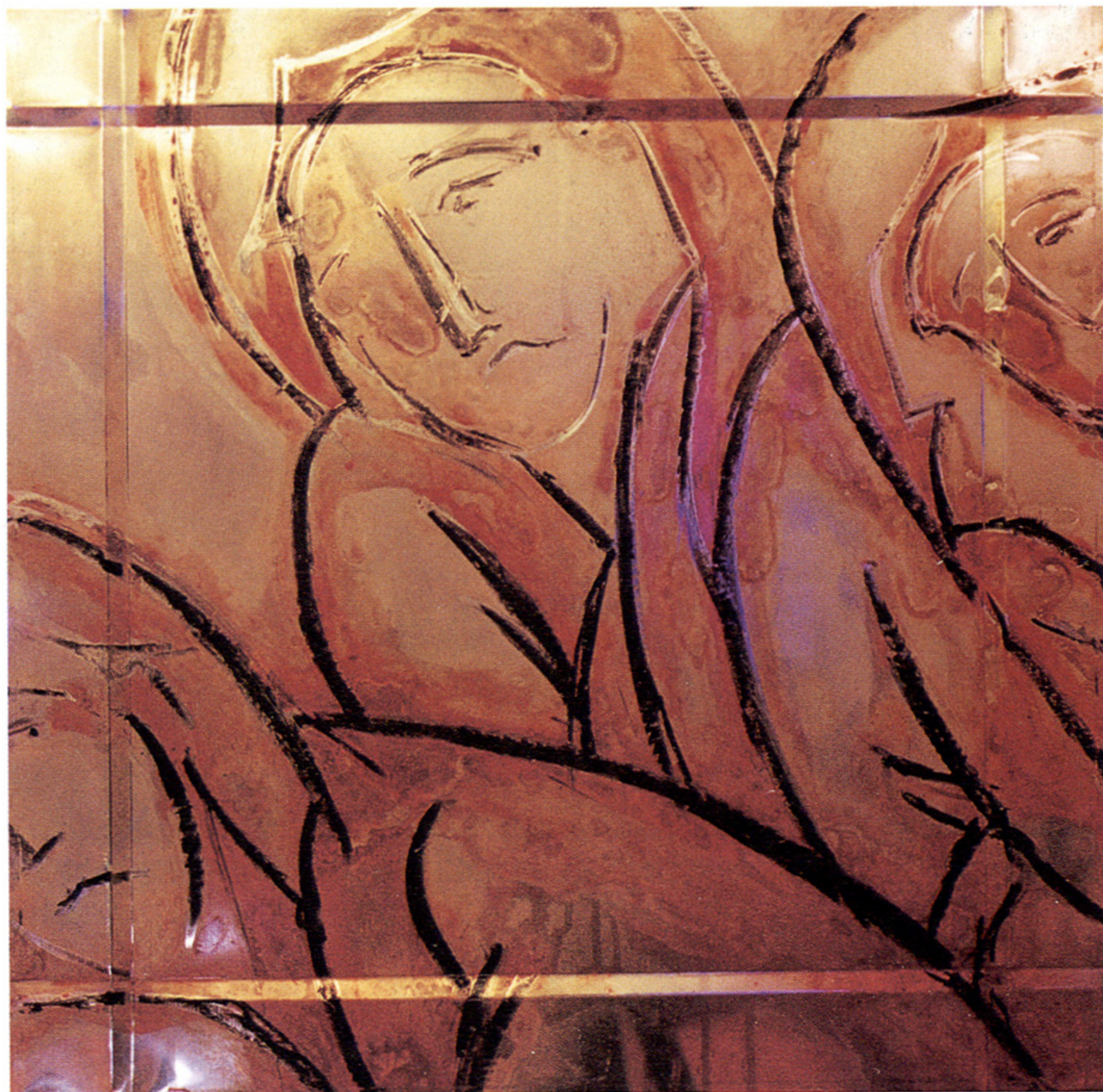
Βυζάντιο, 1994 Ανοξείδωτη λαμαρίνα, λαδοπαστέλ, σινική 50 x 50 εκ.