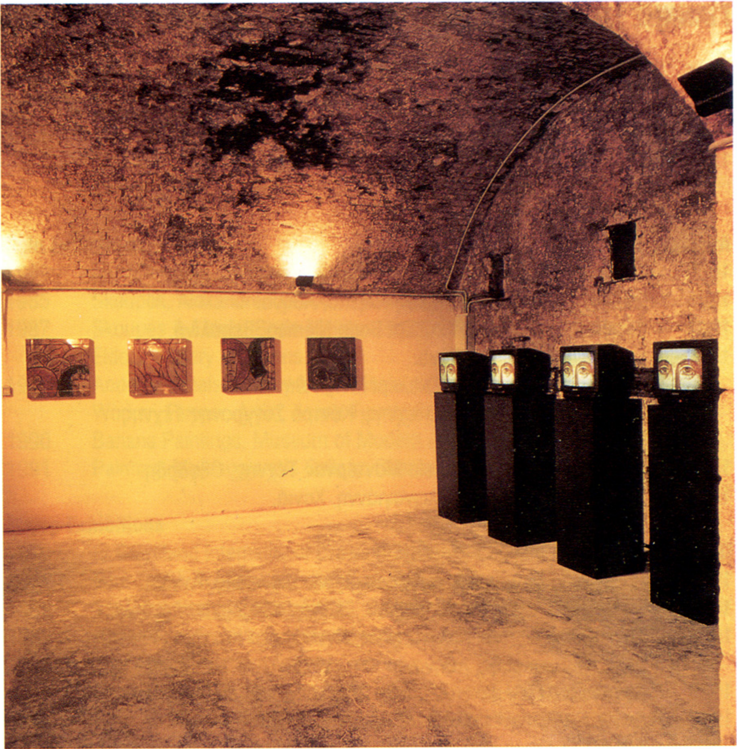
Βυζάντιο, 1994 Βίντεο-Εγκατάσταση