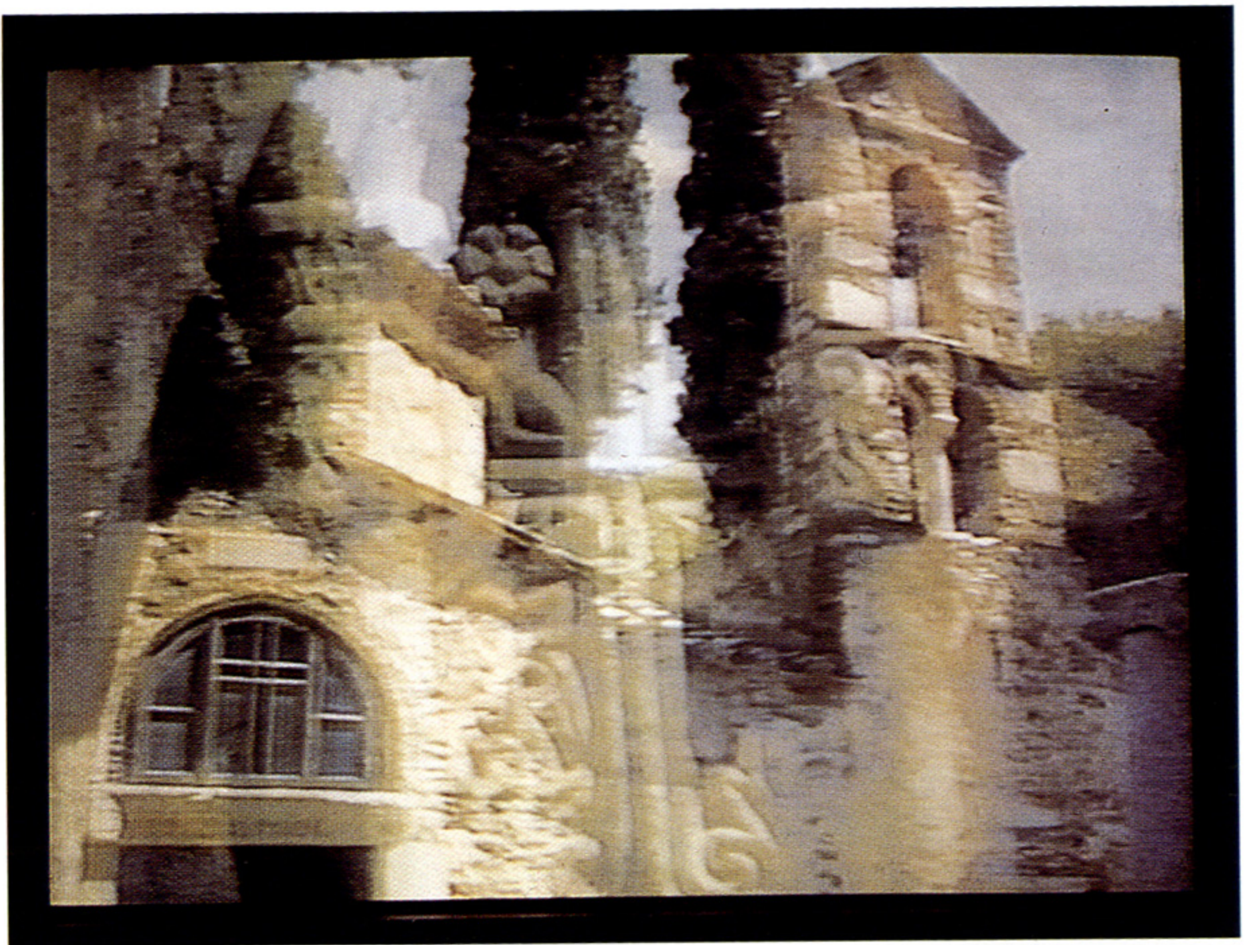
Βυζάντιο, 1994 Video