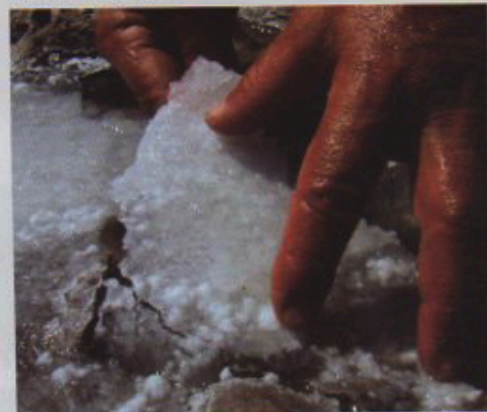
Sol / Salt de Tori Mestrovic

Sol / Salt de Tori Mestrovic (Croatie 2012) Cette installation prend appui sur les histoires des anciens de Dalmatie, où il est question de pauvreté et de collecte du sel de mer sur les côtes rocheuses des îles de l'Est Adriatique. Les Républiques de Dubrovnik et de Venise, qui dans le passé dominaient les pays de l'Est Adriatique, avaient le monopole total de la production et du commerce du sel, déclarant la collecte du sel comme illégale, même pour la population locale et les pêcheurs.